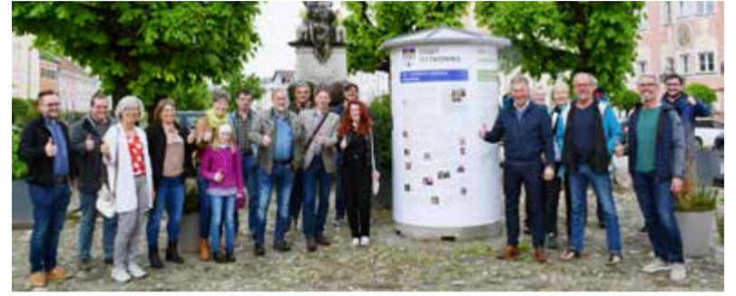
Die Teilnehmenden des Frühschoppens an der aktualisierten Info-Säule.

Mitdenken, kreativ gestalten, unterstützen