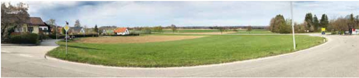
Kay-Mitte: Nachhaltige Wärmeversorgung fürs neue Baugebiet

Angeht die aktuelle Baupreisentwicklung in Hoch- und Tiefbau wird der Stadtrat auch die Grundstückspreise gegenüber der ursprünglichen Planung noch einmal prüfen.