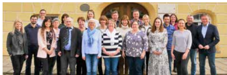
Das Rathausteam ist gerne für Sie da.

Unter www.tittmoning.de informieren wir immer aktuell über das Wichtigste aus Stadt und Verwaltung. Der Webauftritt der Stadt wird derzeit optimiert und soll im Laufe des Sommers in neuem Design mit übersichtlicher Struktur noch ansprechender werden.