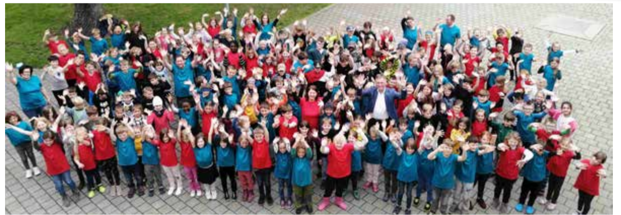
Faire Schul-T-Shirts: Die von der Stadt geförderte Aktion, die bei Kindern, Eltern und Kollegium großen Anklang fand, trägt dazu bei, dass in unserer Stadt das Bewusstsein für globale Verantwortung wach bleibt.