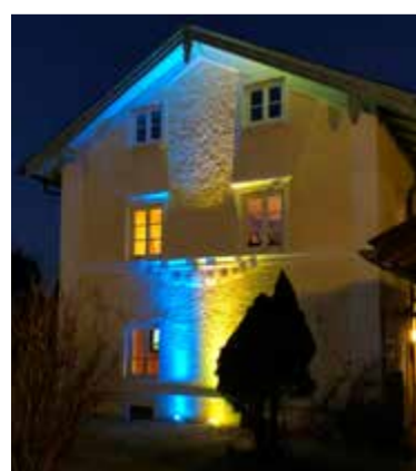
Solidarität mit der Ukraine: Das JUZ leuchtet in den Nationalfarben

Angesichts der Entwicklungen in der Ukraine ist zu erwarten, dass die Zahl der Geflüchteten weiter steigt, auch in unserer Stadt. Schön wäre es, wenn sich auch die Basis des ehrenamtlichen Engagements in diesem Bereich noch weiter verbreitern würde. Nach wie vor benötigt werden finanzielle Unterstützung, Wohnraum und Freiwillige für Deutschunterricht, Fahrdienst und mehr. Darüber hinaus ist es gerade für die Kinder und Jugendlichen wichtig, möglichst bald Anschluss an Gleichaltrige zu finden. Neben dem Haus für Kinder und dem JUZ können die örtlichen Vereine zu Orten der Begegnung werden. Angebote zur gemeinsamen Freizeitgestaltung gibt die Bürgerhilfsstelle gerne gezielt weiter.