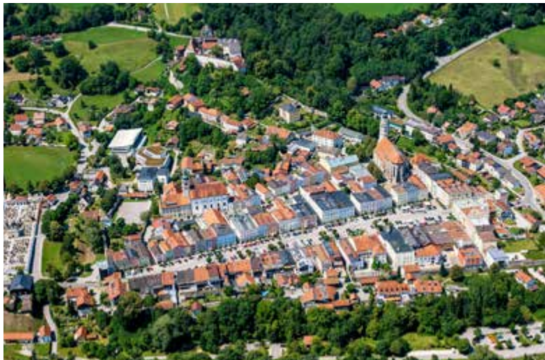
Die historische Altstadt steht zunächst im Zentrum der Leerstandsoffensive

Wir bestimmen aktiv, wie Tittmoning sich entwickelt