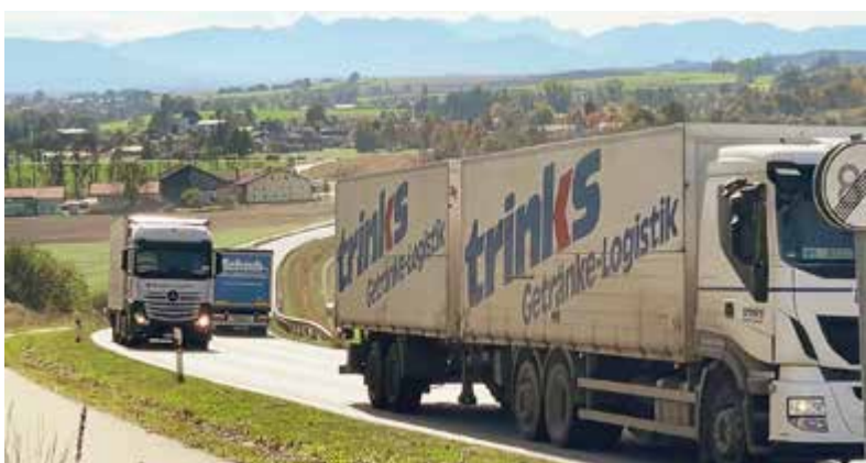
Schwerlastverkehr auf der LKW-Umfahrung am Kayer Berg