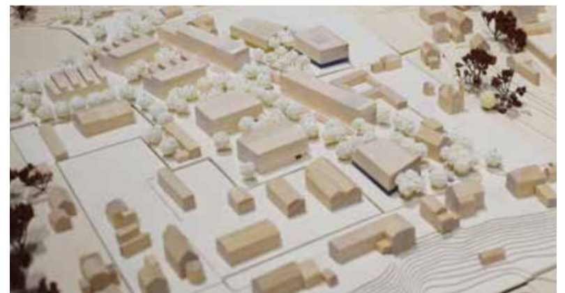
Das neue Wohngebiet im Modell (H2R Architekten) von Osten gesehen

Auf der Projektwebsite können Sie sich auch für den Newsletter anmelden und noch bis Ende des Jahres Ihren individuellen Bedarf an Wohnraum melden.