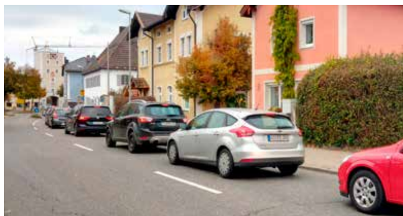
Rückstau vor dem Stadttor auf der Laufener Straße