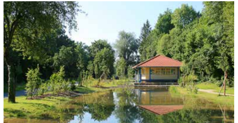
...und das Wasserkraftwerk in der Wasservorstadt ging 2006 ans Netz.

nächsten Jahres zur Abstimmung vorlegen.