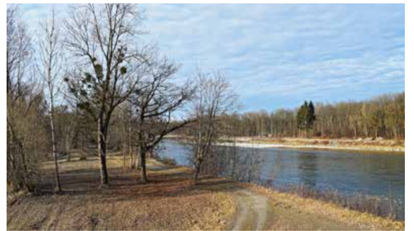
Die Gehölzfällarbeiten im Zusammenhang mit den No-regret-Maßnahmen zur Aufweitung der Salzach sollen bis Ende Februar abgeschlossen sein. Spätestens im März werden die Fuß- und Radwege am Salzachufer in Richtung Burghausen wieder freigegeben.

Aktuelle Stellenausschreibungen der Stadtverwaltung sind unter www.tittmoning.de zu finden.