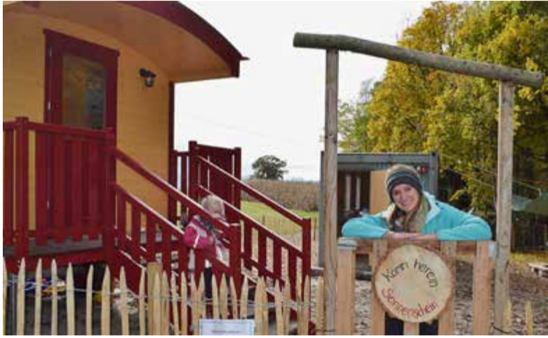
Neu in Moosburg am Hüttenthaler Feld: der WATOLA-Naturkindergarten

Tittmonings Kindertagesstätten bieten bedarfsgerechte Angebote