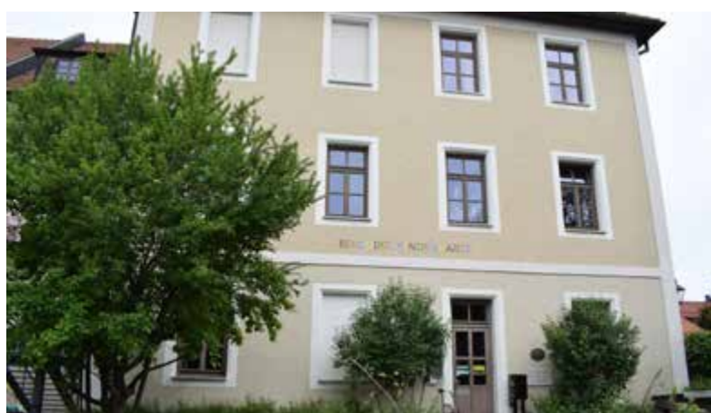
Der Benedikt Kindergarten bietet auch Ganztagsplätze.

Derzeit arbeiten in den städt. Kindergärten und -krippen 9 Vollzeitkräfte 35 Teilzeitkräfte und in der Mittagsbetreuung 7 Teilzeitkräfte