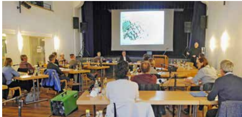
Der Stadtrat tagt bis auf Weiteres im Stadtsaal (ehem. Braugasthof).

Mit Weitsicht geplant: Der städtische Haushalt bringt Tittmoning weiter nach vorn