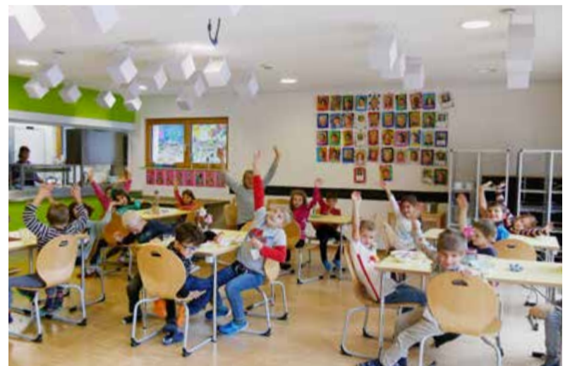
Frisch zubereitet wird das Mittagessen im Haus für Kinder.

Der Bedarf fürs nächste Schuljahr wird bei Grundschulkindern der aktuellen Klassen 1 bis 3 von der Schule per Post abgefragt. Schulanfänger erhalten ein Formular zur Anmeldung bei der Mittagsbetreuung im Zusammenhang mit der Schuleinschreibung.