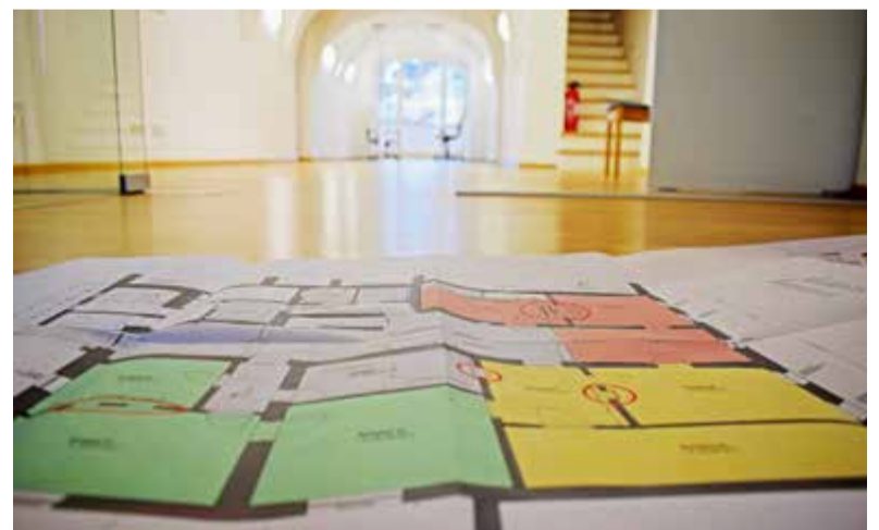
Plan für die Kinderkrippe in ihren neuen Räumen im Benedikt-Palais

Nähe des Schulgebäudes eingestellt. Darüber hinaus wird für Tittmonings Kindertagesstätten langfristig eine bauliche Gesamtlösung angestrebt, die alle Kindergarten- und Krippengruppen des Benedikt Kindergartens (mit Ausnahme der Waldeulen) mit ausreichend Platz gut unterbringt und dabei noch Raum für demnächst wohl erforderliche zusätzliche Plätze bietet. Die Standortsuche dafür ist im Gange.