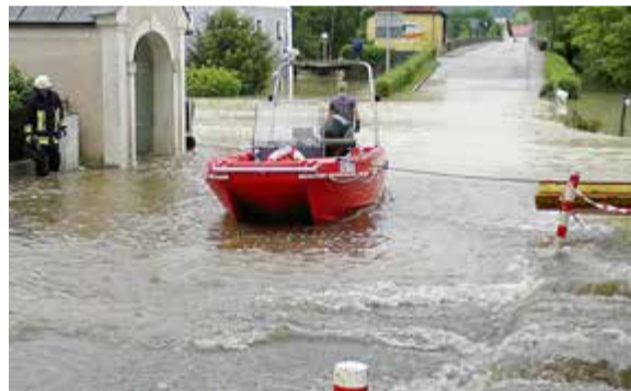
Die Feuerwehren im Einsatz beim Hochwasser 2013

Ein Wiederholungsaudit, bei dem insbesondere geprüft wird, inwieweit die empfohlenen Maßnahmen umgesetzt wurden und wirksam sind, ist für 2025 geplant.