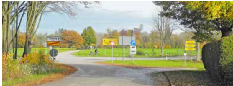
Zwei Gefahrenstellen im Stadtgebiet: Kreuzung an der Mönchsbergstraße und Durchgang im Stadttor.