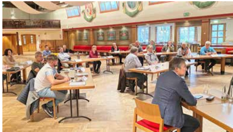
Was nach Bierhalle aussieht, ist der Ort der Klausurtagung des Stadtrats im Oktober: der Kursaal in Ruhpolding