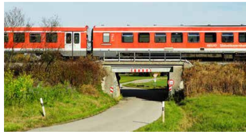
Die Unterführung bei Mittereich, eines der betroffenen Kreuzungsbauwerke

über die Website der DB Netz AG oder telefonisch unter 069 67 77 65 514 (nach dem Einwählen bei Aufforderung lediglich diese Konferenz-ID per Telefon eingeben: 314 405 526 #).