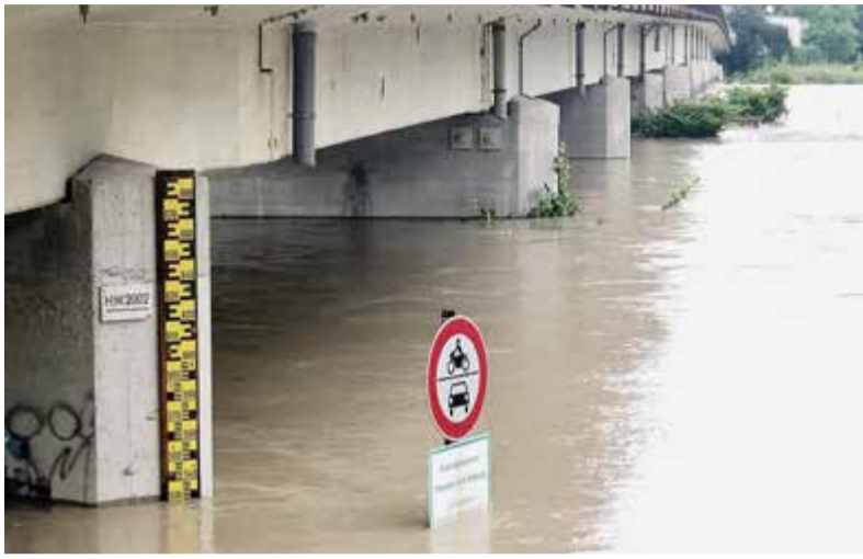
Auch 2020 war der Pegelstand wieder besorgniserregend.

Besser vorbereitet auf Flusshochwasser und Starkregen