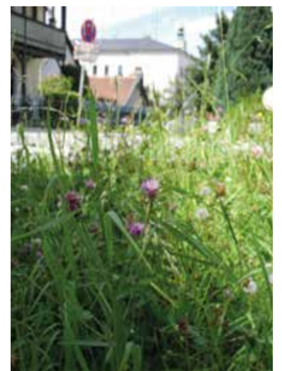
Eine „wild blühende“ Ecke auf städtischem Grund am „Bindergartl“

unterschätzt werden. Tittmoning will seinen Teil dazu beitragen.