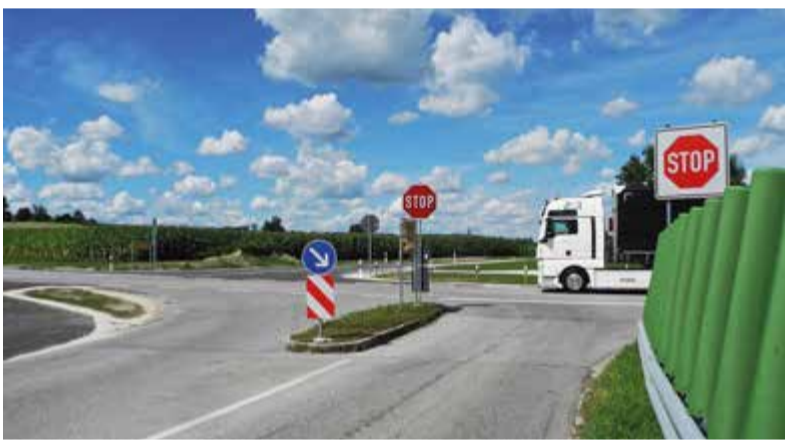
Die Kreuzung bei Abtenham wurde verschwenkt, um das Unfallrisiko zu senken.

Zwei Straßenbaumaßnahmen sorgen dafür, den Verkehr rund um Tittmoning künftig sicherer zu machen: Die Ende Juli vollendete Verschwenkung der Abtenhamer Kreuzung entschärft den bisherigen Unfallschwerpunkt südlich von Kirchheim an der Kreisstraße TS 16 und der Einschleifer bei Grassach, der bis Ende September fertiggestellt wird, verbindet mit den Staatsstraßen 2105 und 2106