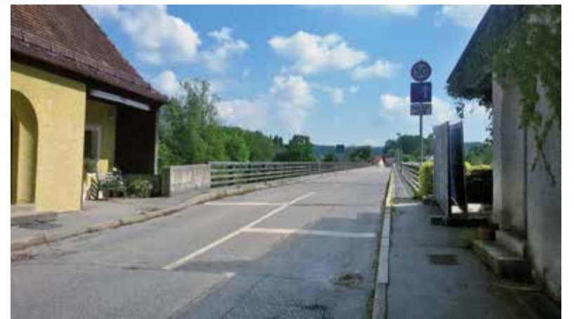
Die Salzachbrücke soll entlastet werden.

platzes vom Durchgangsverkehr durch eine Umfahrung sieht.