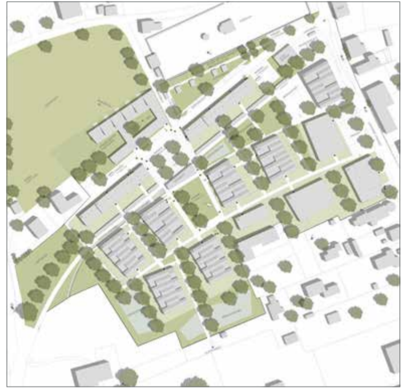
Das neue Viertel im Plan (© H2R Architekten und Stadtplaner BDA). Nähere Erläuterungen und Details zum Preisträger-Entwurf finden Sie in der nächsten Ausgabe der SchauRein!