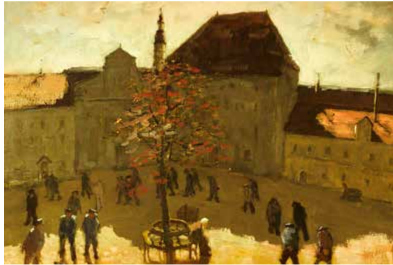
Gemälde von Josef Nassy 1943, US Holocaust Memorial Museum, Washington, Geschenk der Severin Wunderman Familie

Ein bislang wenig bekanntes Kapitel aus der jüngeren Geschichte unserer Burg beleuchtet seit Anfang Mai die sehenswerte Ausstellung „Free Again! – Prisoners of War erzählen“. Auf Anregung von Ortsheimatpfleger Manfred Liebl verleiht die umfassende Dokumentation über die Rolle der historischen Befestigungsanlage als Kriegsgefangenen- und Internierungslager im Zweiten Weltkrieg den damaligen Gefangenen Gesicht und Stimme.