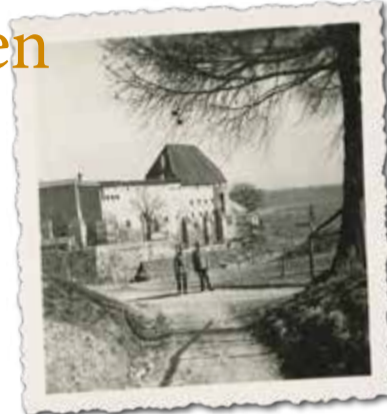
Zwei Offiziere der Wachmannschaft vor der Burg

hier unter, und zuletzt war im April 1945 noch eine Gruppe „prominenter“ Gefangener in Tittmoning, die als Geiseln für besondere Austauschaktivitäten vorgesehen waren. Insgesamt wurden in der Burg über die fünf Jahre knapp tausend Menschen gefangen gehalten. Das Verdienst der Ausstellung ist, dass sie hinter den Zahlen deutlich spüren lässt: Jedes Einzelschicksal zählt.