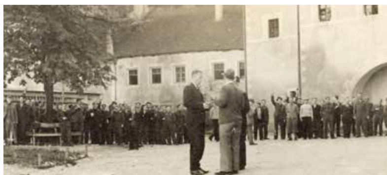
Ein Delegierter des Internationalen Roten Kreuzes bei einer Visite in der Burg 1942

Die bewegenden Lebensläufe bilden das Herzstück der Ausstellung, die außerdem Daten und Fakten zur Lagergeschichte, auch zu Wachmannschaften und Hilfsorganisationen, liefert und in den historischen Zusammenhang von NS-Diktatur und Weltkrieg einordnet. Von 1940 bis 1941 war die Burg belegt mit ca. 300 britischen Offizieren, von 1942 bis 1944 mit bis zu 370 zivilen Internierten. 1944 und 1945 brachte man rund 300 niederländische Offiziere