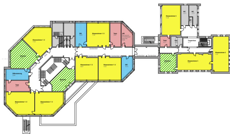
Eine mögliche Planung für das 1. Obergeschoß der Schule: Die Klassenzimmer (gelb) der Klassen 1/2 (linker Trakt) und der 3. Klassen (rechter Trakt) gruppieren sich um je einen gemeinsamen Marktplatz-Bereich (grün). Weiter vorgesehen: Teamräume (rosa) und Differenzierungsbereiche (blau).

Andreas Bratzdrum Andreas Bratzdrum Erster Bürgermeister