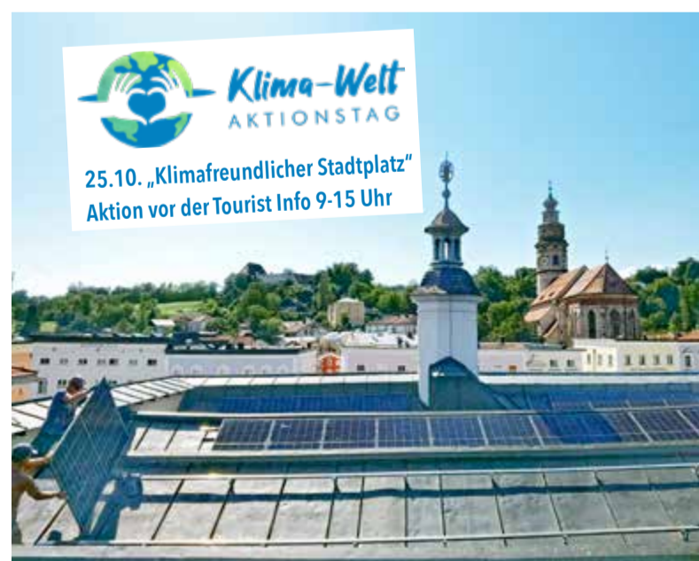
Auf der Dachfläche des Rathauses wurden Solarmodule montiert.

Neben Wind und Erdwärme gehört die Sonne zu den wichtigsten erneuerbaren Energieträgern. Bei ihrer Nutzung ist Tittmoning schon lange ganz vorn dabei. Nach der Schule und dem Haus für Kinder konnten nach Abschluss der statischen Untersuchungen jetzt ganz aktuell auch noch das Rathaus und der Braugasthof mit PV-Dachanlagen ausgestattet werden. Beide Anlagen sollen ca. 30kWp (Rathaus) bzw. 15kWp (Braugasthof) Strom liefern, die weitgehend für den Eigenverbrauch vorgesehen sind. So wird auf immer mehr städtischen Liegenschaften auch die Sonnenenergie ideal genutzt, um CO 2 -neutral Strom zu produzieren, das Klima zu schützen und zugleich den städtischen Haushalt zu entlasten.