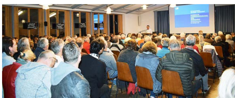
Beim Bürger-Infoabend am 23. Oktober im Pfarrsaal herrschte großes Interesse