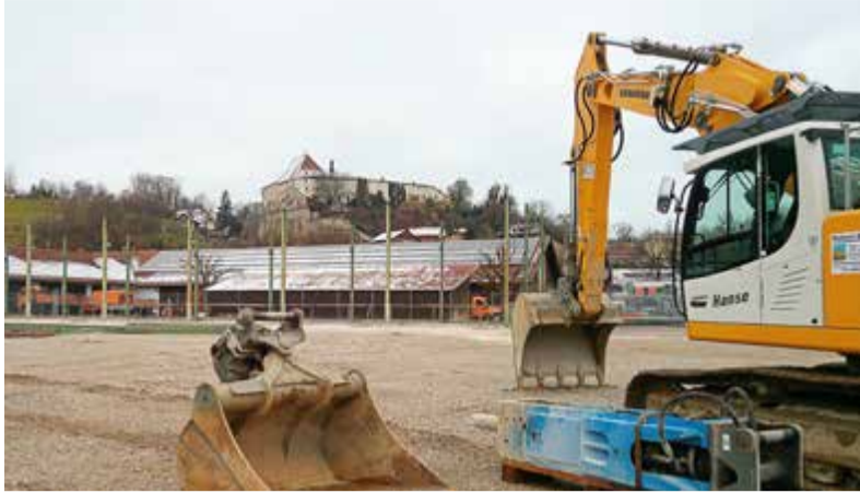
Mit dem Abriss der letzten Brückner-Halle ist das Baugelände „Am Alten Bahnhof“ jetzt frei von Bebauung.